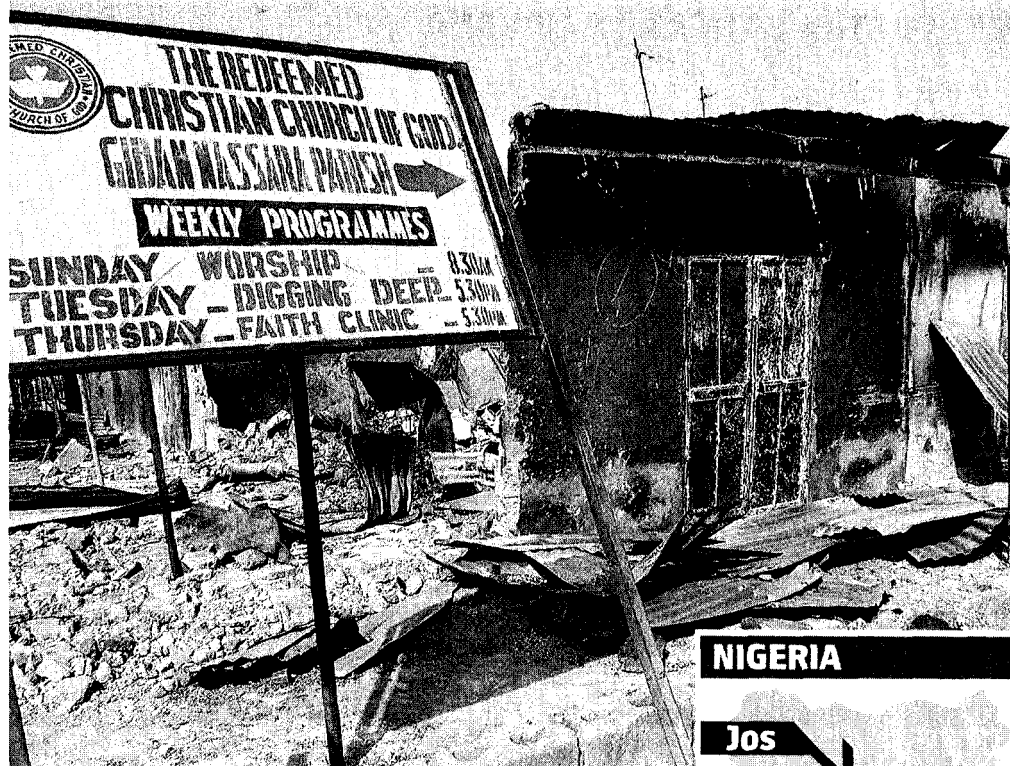
IL RISULTATO DELL'ODIO Una chiesa bruciata in Nigeria